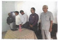
Tamil Thasai Prayer