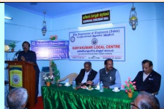
Welcome Address by Chairman, KKLC