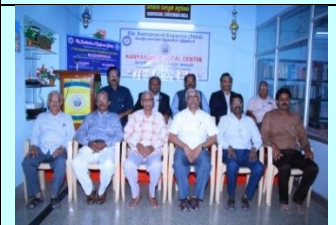
KKLC Committee Members with President IEI